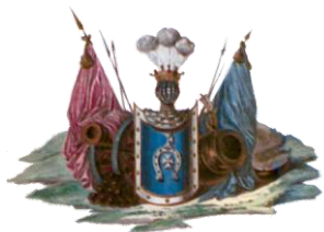
„KRZYWDA” Herb Rodu Moniuszków